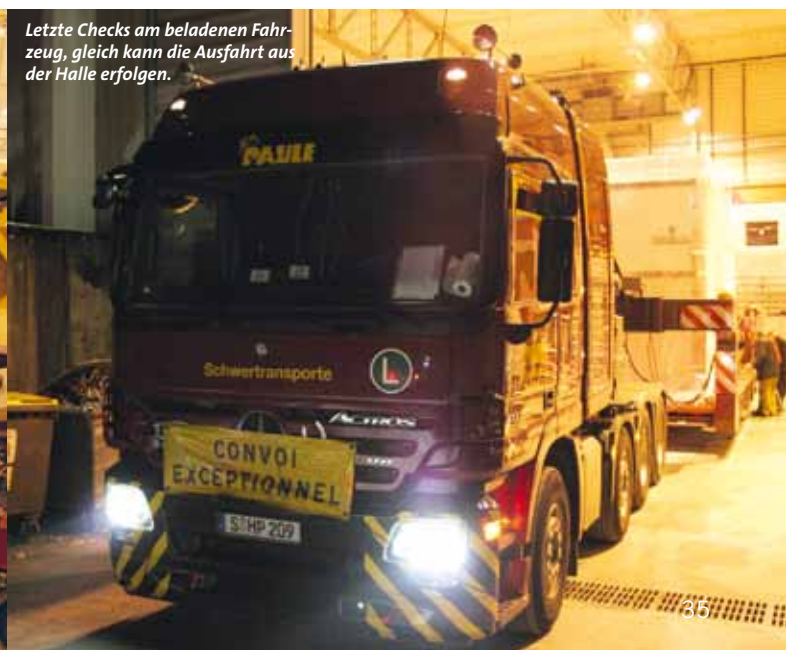
Letzte Checks am beladenen Fahrzeug, gleich kann die Ausfahrt aus der Halle erfolgen.