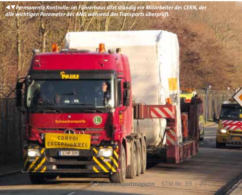
◀◀ Permanente Kontrolle: im Führerhaus sitzt ständig ein Mitarbeiter des CERN, der alle wichtigen Parameter des AMS während des Transports überprüft.