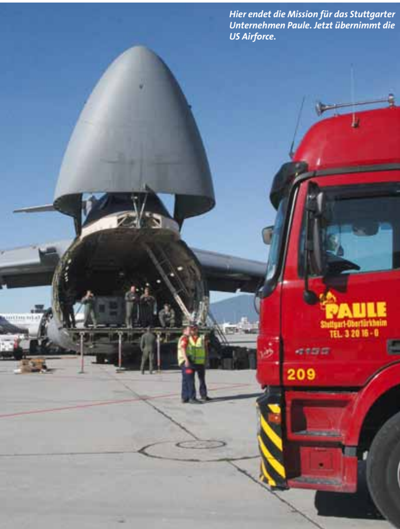
Hier endet die Mission für das Stuttgarter Unternehmen Paule. Jetzt übernimmt die US Airforce.

ren durfte und in Deutschland bei Tag – normalerweise wäre es genau anders herum. Hier haben alle beteiligten Behörden und die Polizei überzeugende Arbeit geleistet, denn ohne deren flexibles Mitwirken wären diese Transporte nicht möglich gewesen.