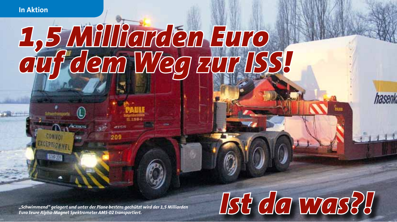
„Schwimmend“ gelagert und unter der Plane bestens geschützt wird der 1,5 Milliarden Euro teure Alpha-Magnet Spektrometer AMS-02 transportiert.