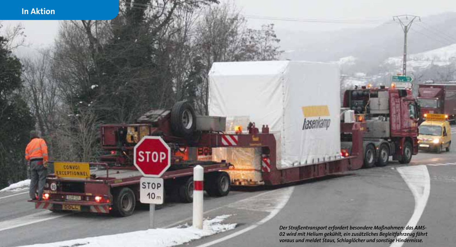
Der Straßentransport erfordert besondere Maßnahmen: das AMS-02 wird mit Helium gekühlt, ein zusätzliches Begleitfahrzeug fährt voraus und meldet Staus, Schlaglöcher und sonstige Hindernisse.