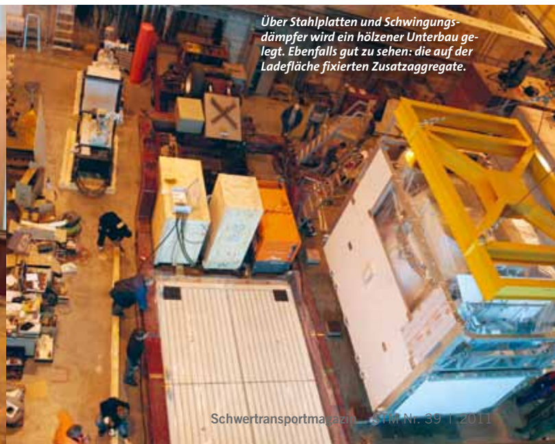
Über Stahlplatten und Schwingungsdämpfer wird ein hölzerner Unterbau gelegt. Ebenfalls gut zu sehen: die auf der Ladefläche fixierten Zusatzaggregate.