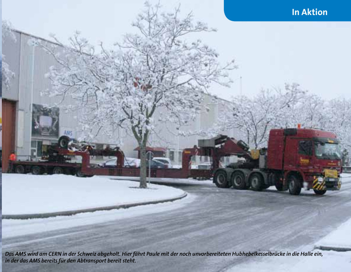
Das AMS wird am CERN in der Schweiz abgeholt. Hier fährt Paule mit der noch unvorbereiteten Hubhebelkesselbrücke in die Halle, in der das AMS bereits für den Abtransport bereit steht.

konnte sich trotz des großen Medieninteresses rund um den Endeavour-Start und trotz der vielen Startverschiebungen entspannt zurücklehnen, denn das Unternehmen hatte die Transporte, die es im Auftrag des CERN im Rahmen des AMS-Projekts durchzuführen hatte, bereits erfolgreich abgeschlossen.