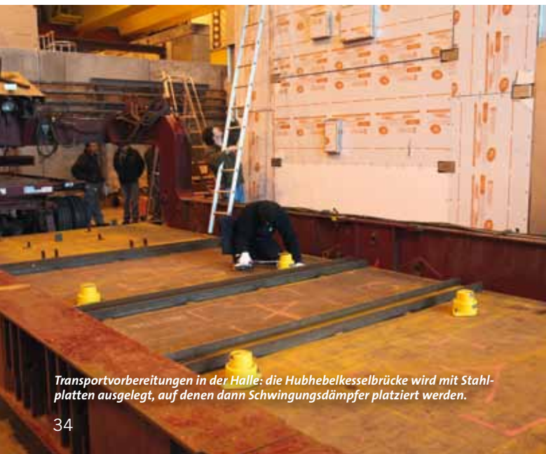
Transportvorbereitungen in der Halle: die Hubhebelkesselbrücke wird mit Stahlplatten ausgelegt, auf denen dann Schwingungsdämpfer platziert werden.

Der Stuttgarter Kran- und Schwertransportdienstleister Hermann Paule GmbH & Co. KG