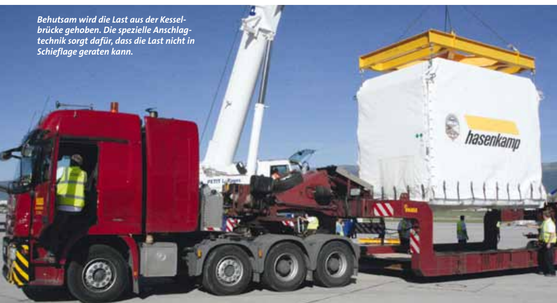
Behutsam wird die Last aus der Kesselbrücke gehoben. Die spezielle Anschlagstechnik sorgt dafür, dass die Last nicht in Schiefelage geraten kann.

Wegen einer Baustelle musste beim Transport vom CERN zur ESTEC ein gewaltiger Umweg in Richtung Grenoble gefahren werden, und das bei starkem Schneefall. Bekanntlich kann in Frankreich nur auf den Nationalstraßen und auf Nebenstraßen gefahren werden. Auch hier zeigte sich der große Vorteil der Hubbrückentechnik, die Paule bei hohen, empfindlichen und langen Bauteilen einsetzt.