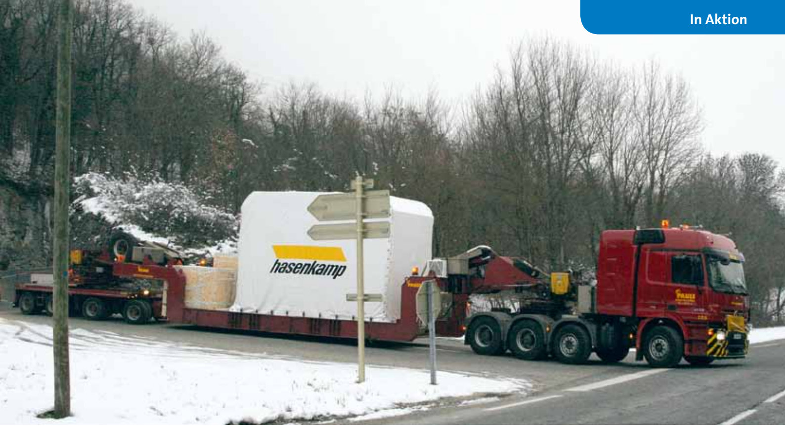
▲▲ Insgesamt bringt es der Transport auf ein Gewicht von 65 t und Abmessungen von 25 x 4,4 x 4,5 m. Mit der um 1,5 m anhebbaren Hubhebelkesselbrücke lassen sich auch schwierige Passagen meistern.